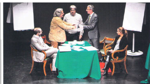
SENSIBILISER LE PUBLIC à la médiation grâce à une pièce de théâtre: une bonne idée!

Lesen Sie den ganzen Artikel (auf Französisch): genevaccord.com/useruploads/ordonsfiles/entreprise_romande_magazine.pdf